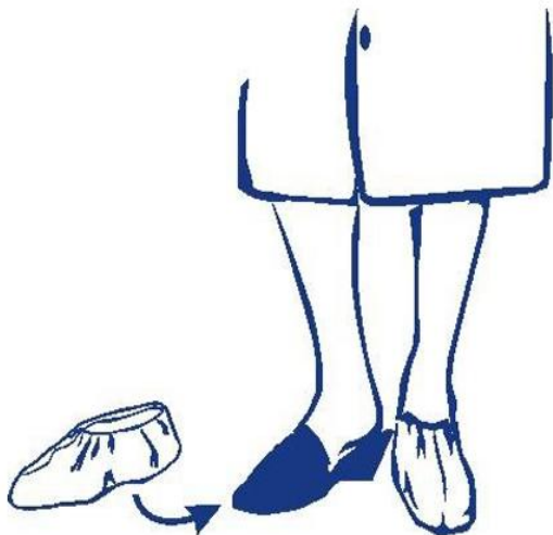
Návleky na obuv ( pár)