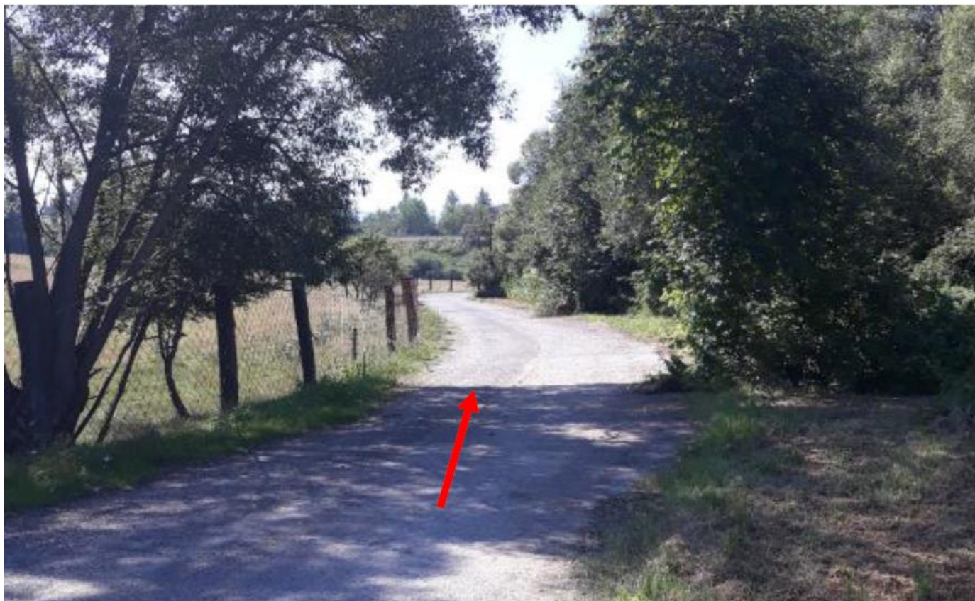
Fotka 3 – cesta k odpadu a jeho poloha