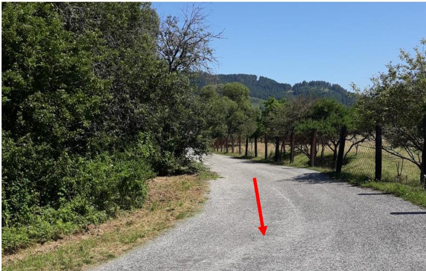
Fotka 5 – cesta k odpadu a jeho poloha