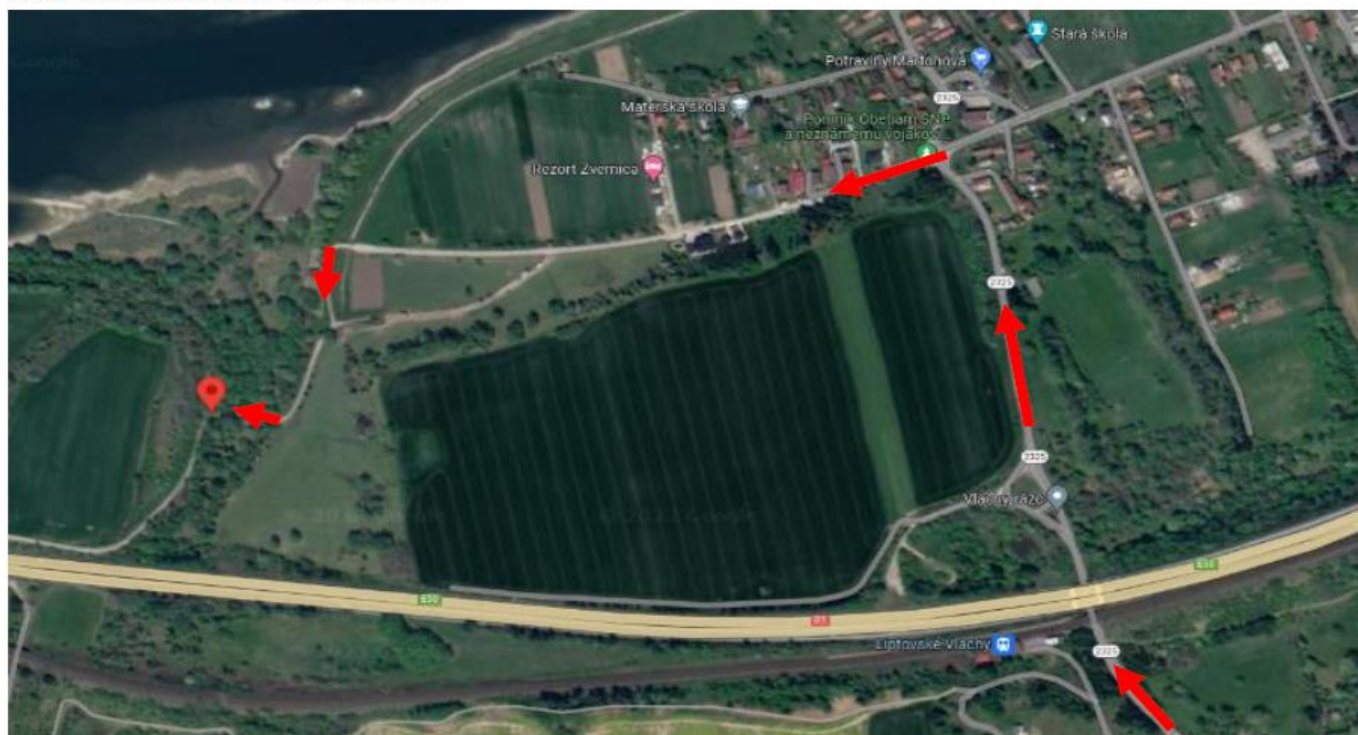
Obr. 1 – Odporúčaná prístupová cesta k miestu odpadu