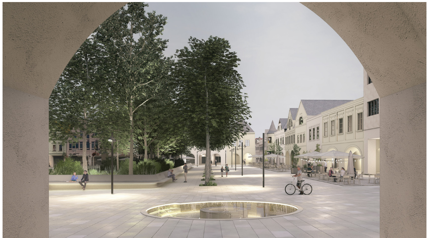
Nová pozícia a reinterpretácia pôvodnej fontány