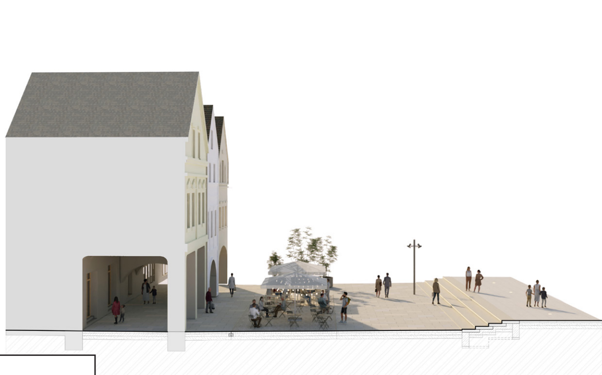
Laubne objektov napojené na plató