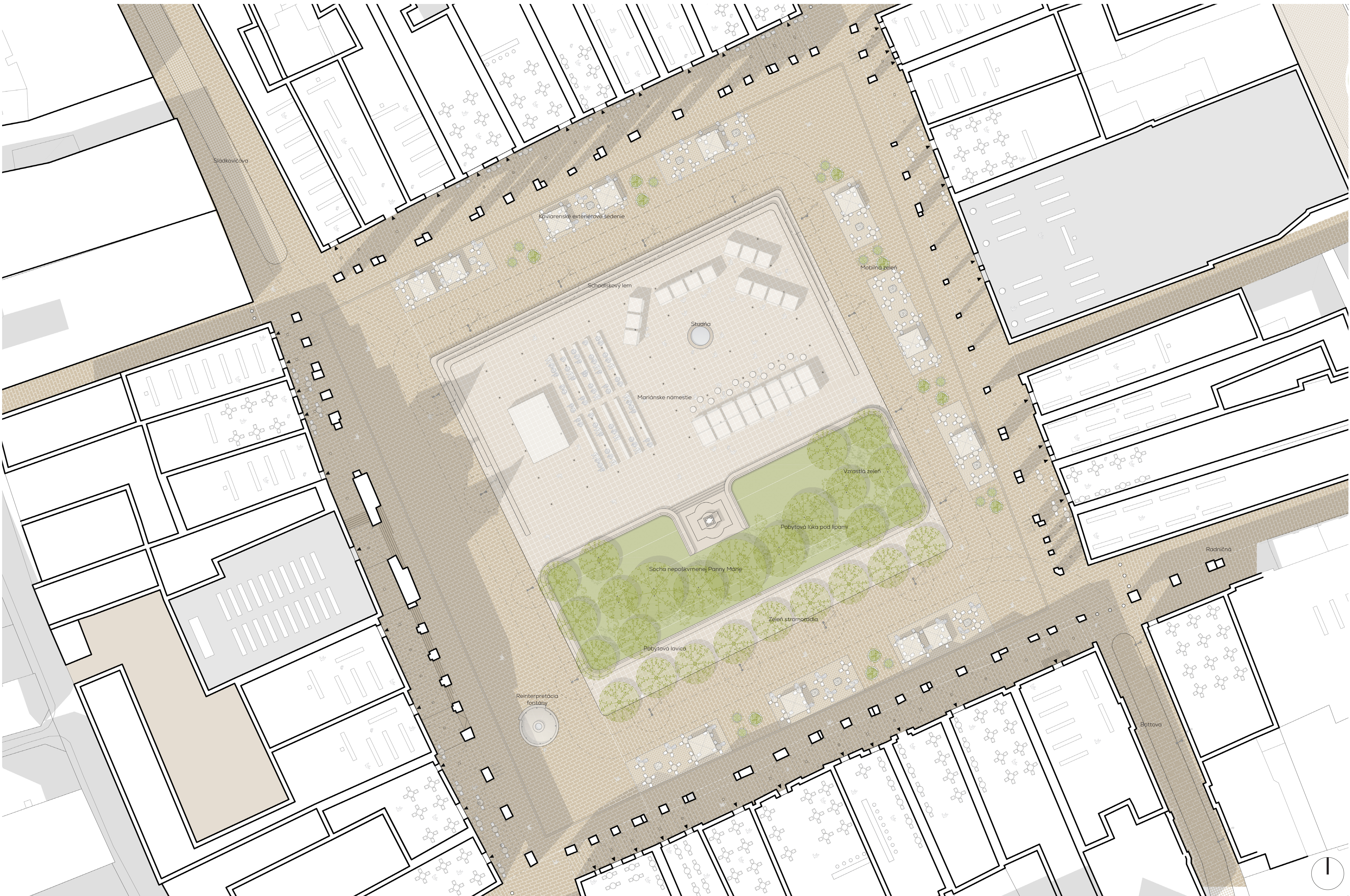
Masterplan M 1:250