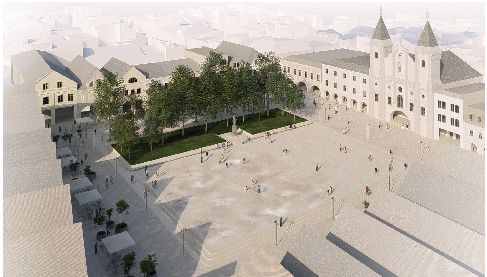
Nadhľad na Mariánske námestie