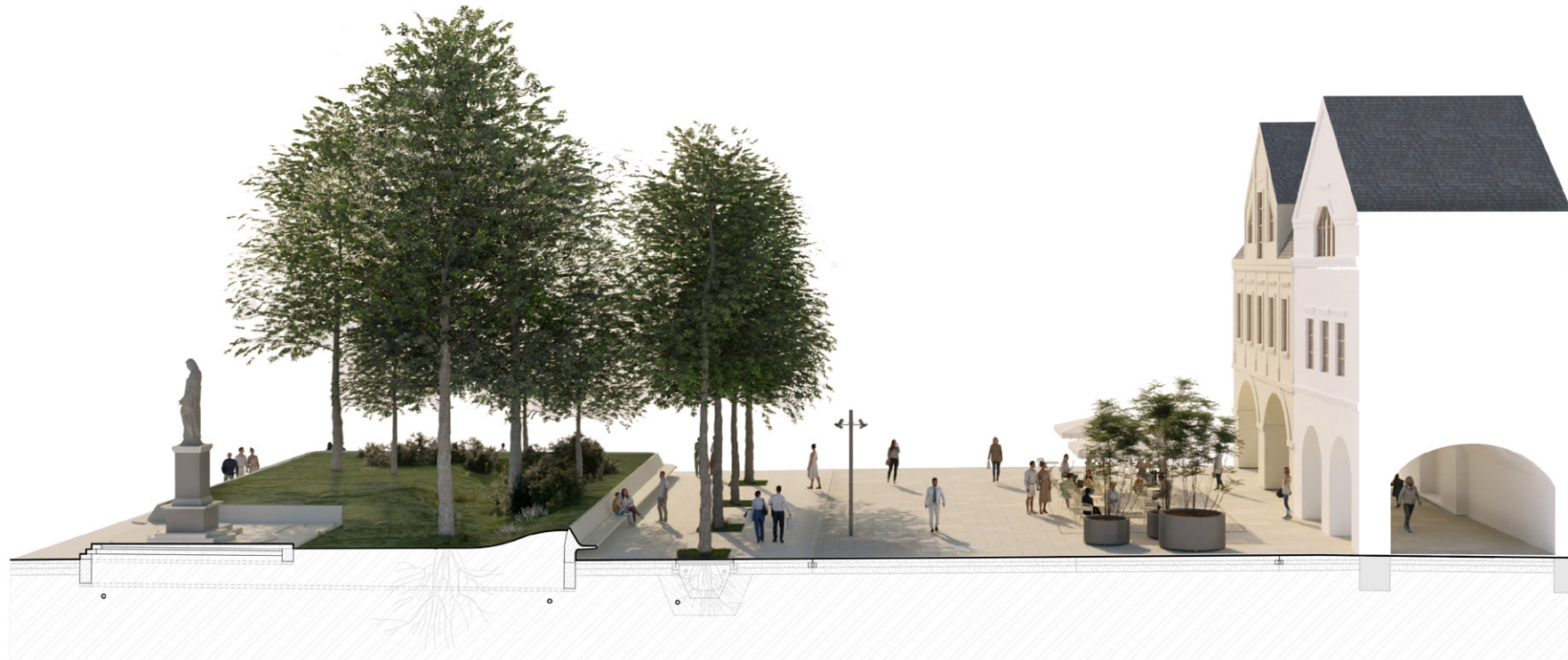
Socha Nepoškvrnenej Panny Márie a sedenie po obvodu zelenej oázy