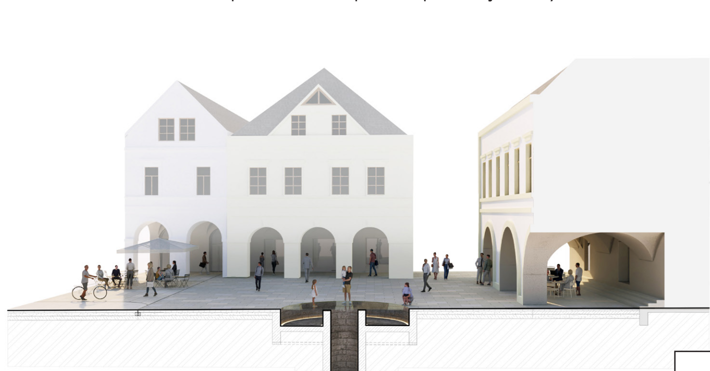
Prezentácia studne v rámci Mariánskeho námestia