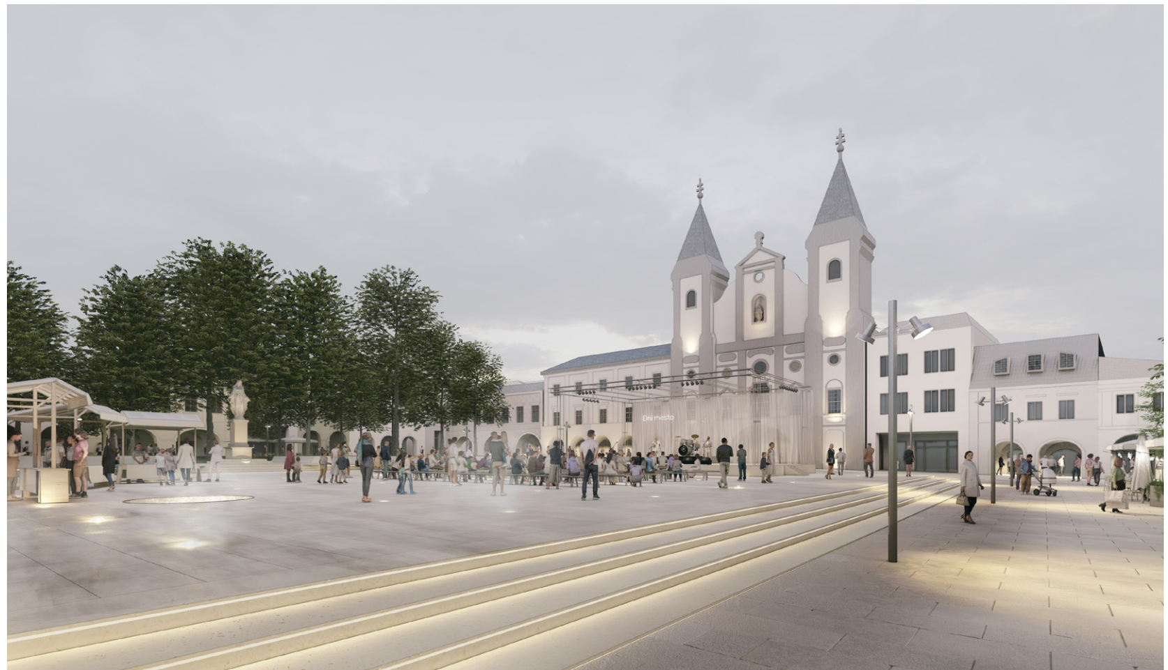
Program na námestí