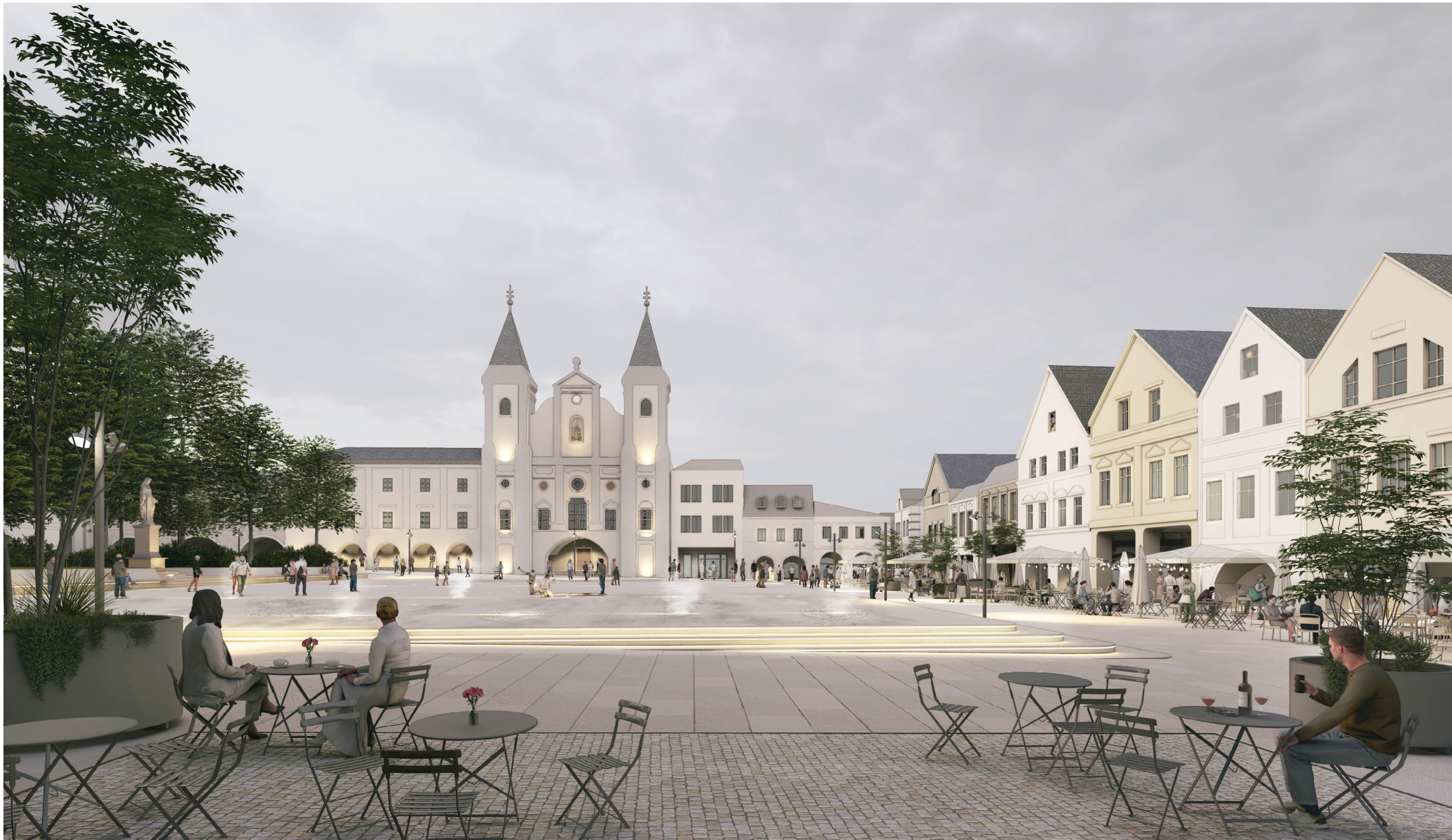
Kostol Obrátenia sv. Pavla v kontexte s námestím