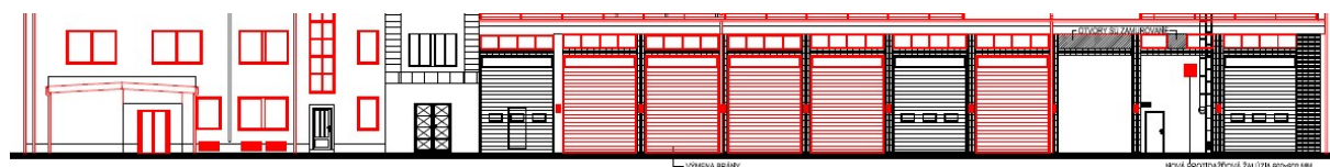
POHĽAD Z DVORA