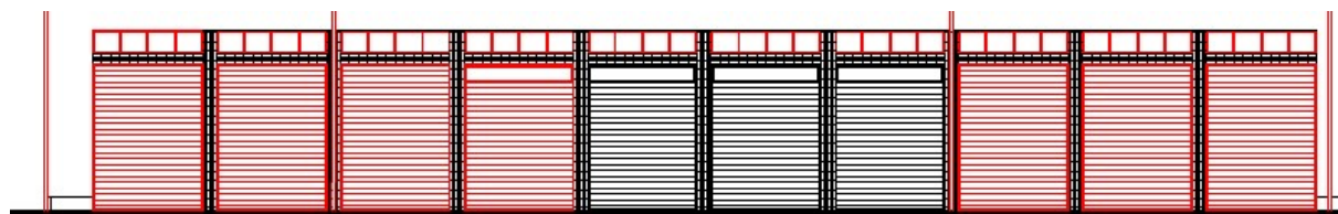
POHĽAD Z HÁLKOVEJ