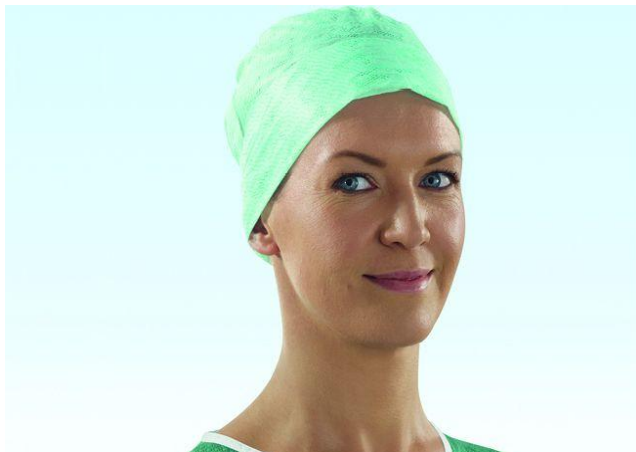
Jednorázová čiapka dámska