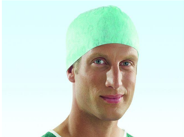
Jednorázová čiapka pánska