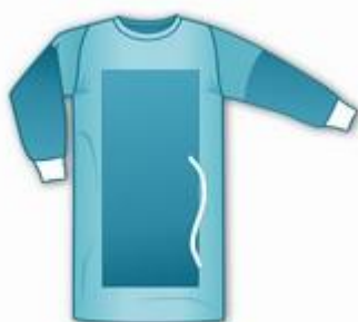
Plášť operačný s vystužením