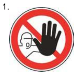
Nepovolaným vstup zakázaný (spolu so značkou č.2, 3 alebo 4 a príslušnou dodatkovou tabuľkou)