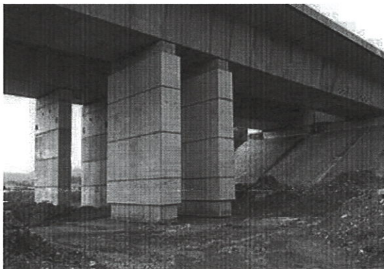
Fotka je z rekonštrukcie mostu v roku 2013.

Mostný objekt D1-236 tvorí spojitá segmentová nosná konštrukcia z priečne delených prefabrikátov s jednokomorovým prierezom z predpätého betónu s deviatimi poľami s rozpätiami 36,0 + 7 × 70,0 + 36,0 m v osi D1. Spodnú stavbu tvoria dve krajné opory a osem dvojíc vnútorných štíhlych stojok.