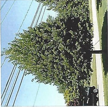
2 Tilia cordata Greenspire (lipa) 6ks