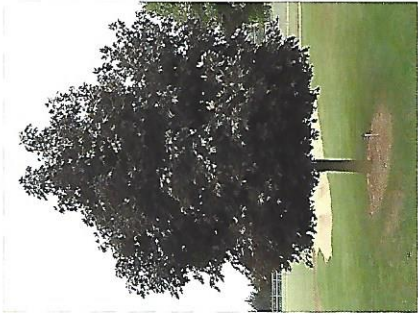
1 Acer platanoides Crimson King (javor bodrdový) 6ks