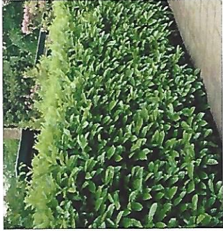
3 Prunus lawrocvarus Novita